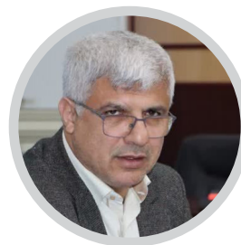
معاون استاندار گلستان:

دیپلماسی و پدافند غیرعامل راه نجات استان از ریزگرد است