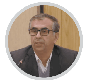
مدیرکل تعاون، کار و رفاه اجتماعی مازندران:

پیش بینی بسته حمایتی برای واحدهای آسیب دیده از جنگ