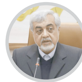
فرماندار رشت تأکید کرد

حضور میدانی مدیران تضمین کننده پایداری خدمات