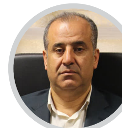
مدیرکل غله و خدمات بازرگانی استان اعلام کرد

آمادگی برای خرید تضمینی گندم در مازندران