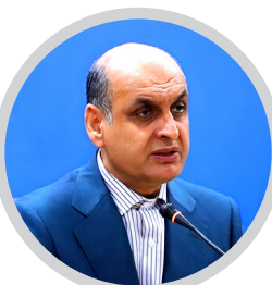
استادار گیلان تاکید کرد

ضرورت پیگیری مشکلات روستای خطیب گوراب فومن