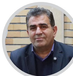
نماینده مردم ساری و میاندوود و رئیس کمیسیون اجتماعی مجلس:

هیچ کارگری نباید در شرایط بحران بدون حمایت بماند