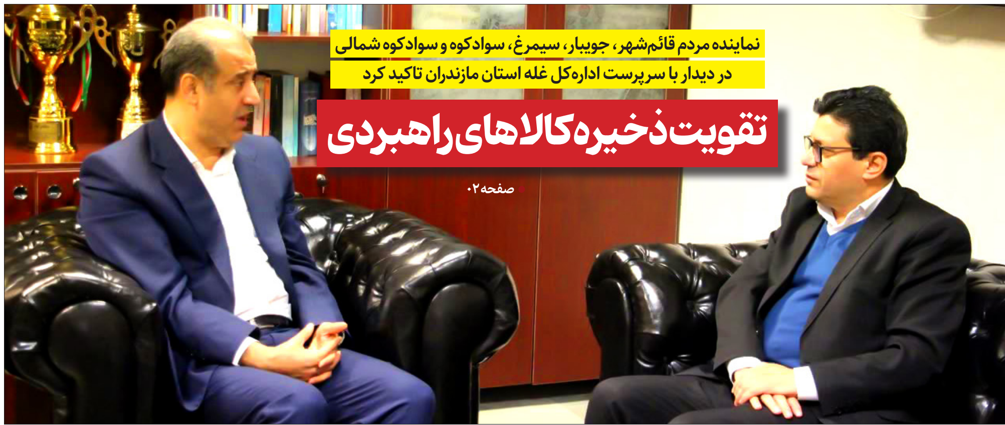
نماینده مردم قائم‌شهر، جویبار، سیمرغ، سوادکوه و سوادکوه شمالی در دیدار با سرپرست اداره کل غله استان مازندران تأکید کرد