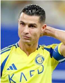
شوک به تیم ملی فوتبال ایران