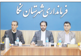
فرمانداری شهرستان نکا

وی ارتقای زیرساخت‌های فنی، هماهنگی با دستگاه‌های اجرایی و مخابراتی، آموزش مجریان و آگاهی بخشی به رأی‌دهندگان را از برنامه‌های در دست اجرای فرمانداری برشمرد و تجربه موفق این شهرستان در انتخابات تمام‌الکترونیک سال ۱۳۹۶ را ظرفیت ارزشمند نکا برای میزبانی انتخاباتی سالم و شفاف دانست.