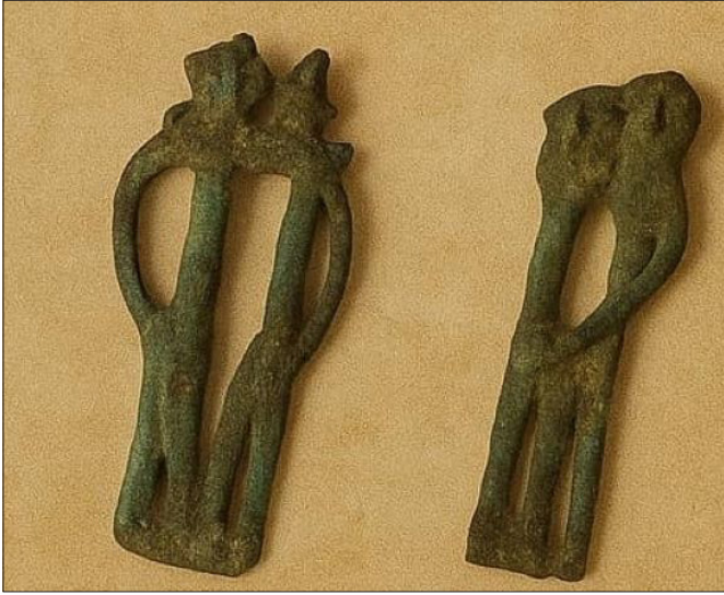
مجسمه‌های مفرغی سه هزار ساله با عنوان «مجسمه‌های زندگی»