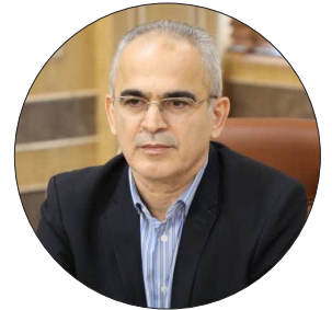
رئیس دانشگاه علوم پزشکی مازندران:

زمین مورد نیاز برای احداث ستاد اورژانسی مازندران تعیین شد