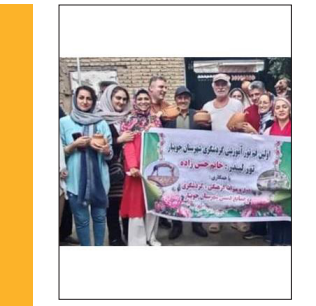
گروه‌های جهادی در مراسم اهدای کمک‌های آموزشی