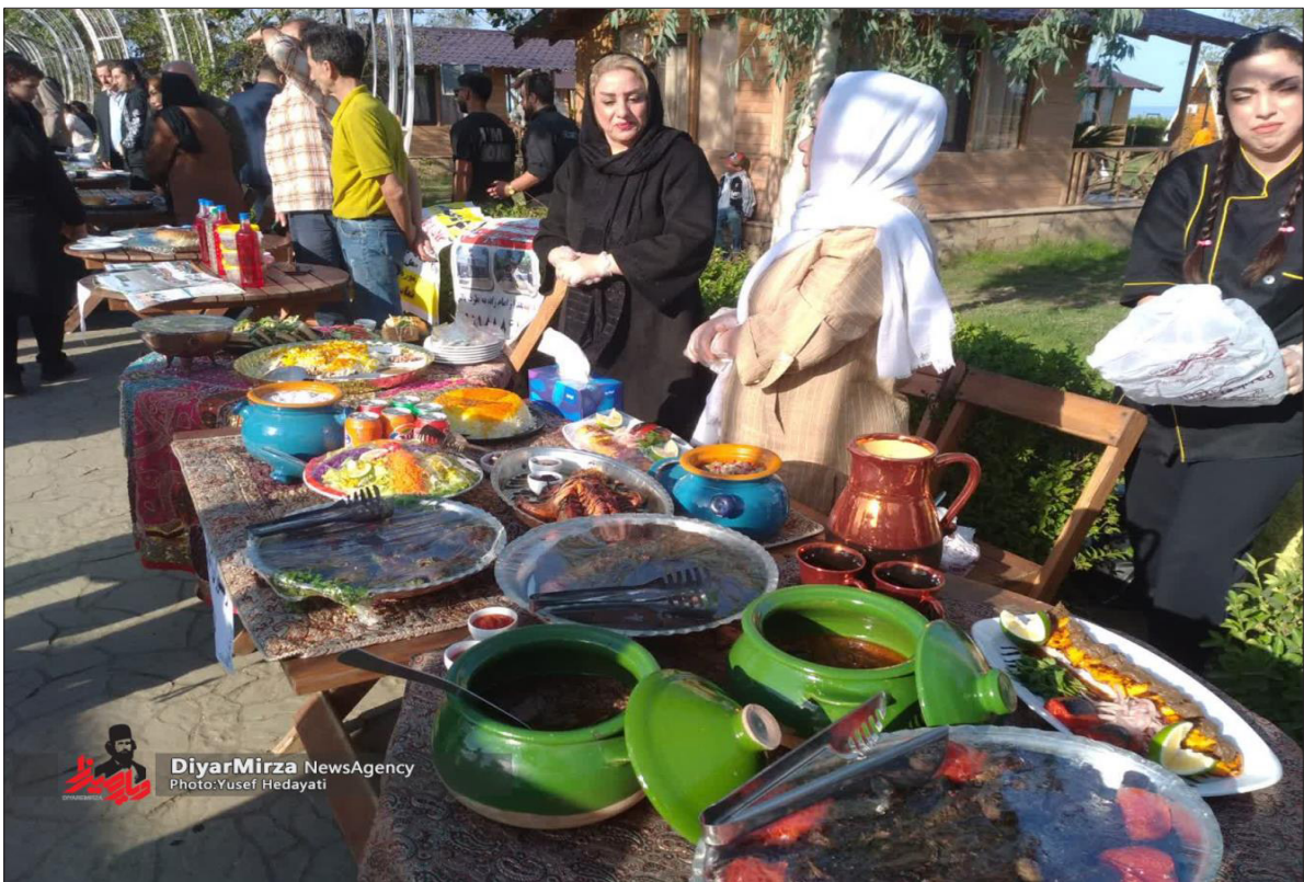
DiyarMirza NewsAgency Photo: Yusef Hedayati