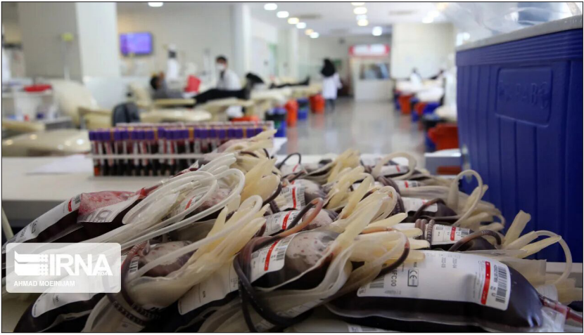
آزمایشگاه پیشرفته ۴۰۰ میلیارد ریالی انتقال خون گلستان

تخت‌های خون‌گیری در مناطق مختلف خبر داد که به تأمین کامل نیازهای خونی استان کمک کرده است با این حال، نبود سردخانه استاندارد همچنان یک چالش است. محمدی گفت: اگر چه مصوبه‌ای برای تخصیص ۱۷۰ میلیارد ریال از بودجه مدیریت بحران