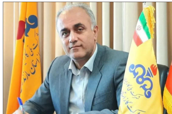
مدیرعامل شرکت گاز استان اعلام کرد: