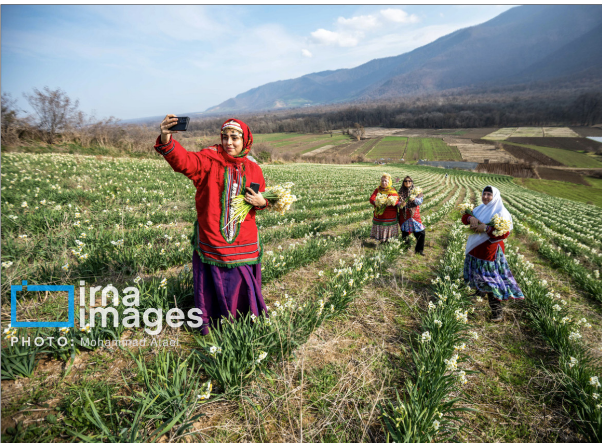
ina images PHOTO: Mohammad Afaei