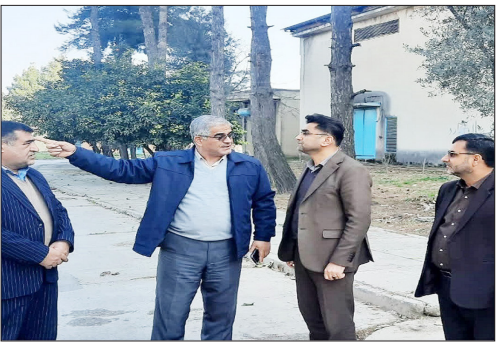
بازدید از موزه سلیولی در محوطه سلیولی نکا