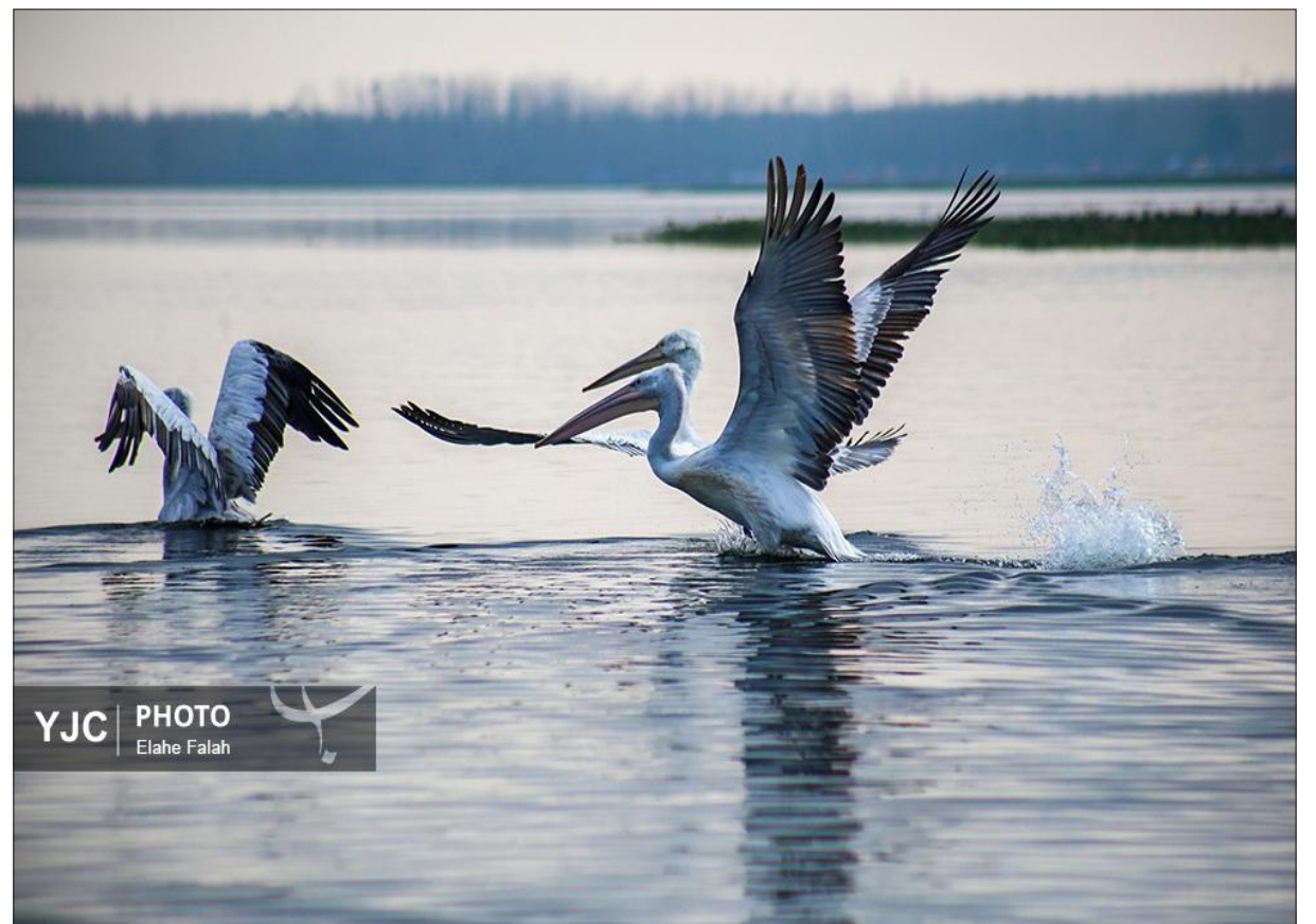
YJC PHOTO Elahe Falah