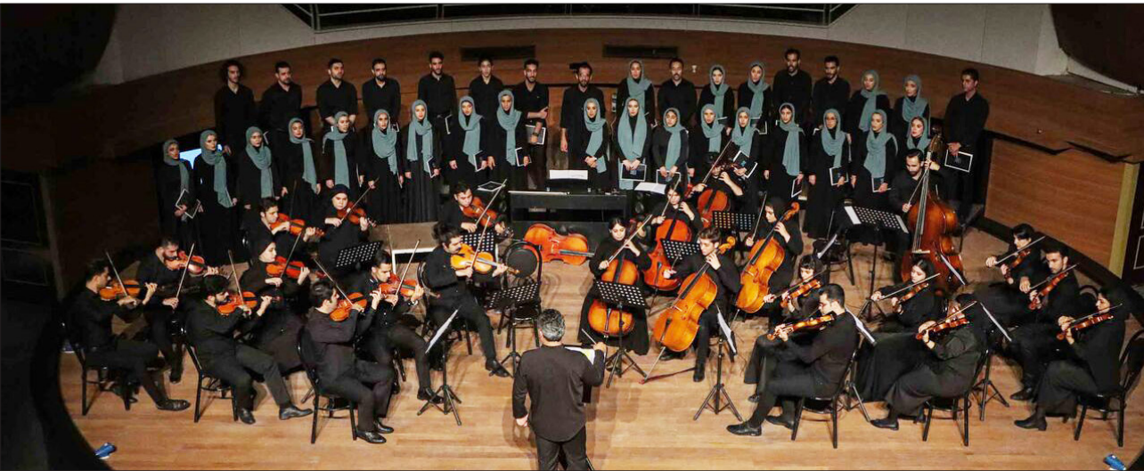
ارکسترزهی کاسپین در جشنوارهٔ «باران» در تالار مرکزی شهر تبریز.

آمیخته به مطالعه، موسیقی و هنر ارزش والایی برای زیبایی و خلاقیت قائلند و این ویژگی‌ها به نوعی هویت فرهنگی آنان را شکل داده است. فرید بریش در رابطه با فعالیت این گروه می‌گوید: برگزاری کنسرت ارکستر کاسپین در رشت گامی دیگر در مسیر گسترش موسیقی کلاسیک و ارتقای فرهنگ هنری در این استان محسوب می‌شود.