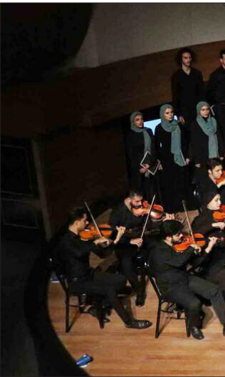
ارکسترزهی کاسپین در جشنوارهٔ «باران» در تالار مرکزی شهر تبریز.

این هم نمودی از آینده نگری و نیک اندیشی اعضای ارکستر کاسپین است که امروز اکثر اعضای آن را جوانانی در سنین ۲۵ و ۲۶ تشکیل می‌دهند و همین‌ها می‌کوشند با جذب و پرورش اعضای جدید در کنسرت نوجوانان پشتوانه‌سازی کنند.