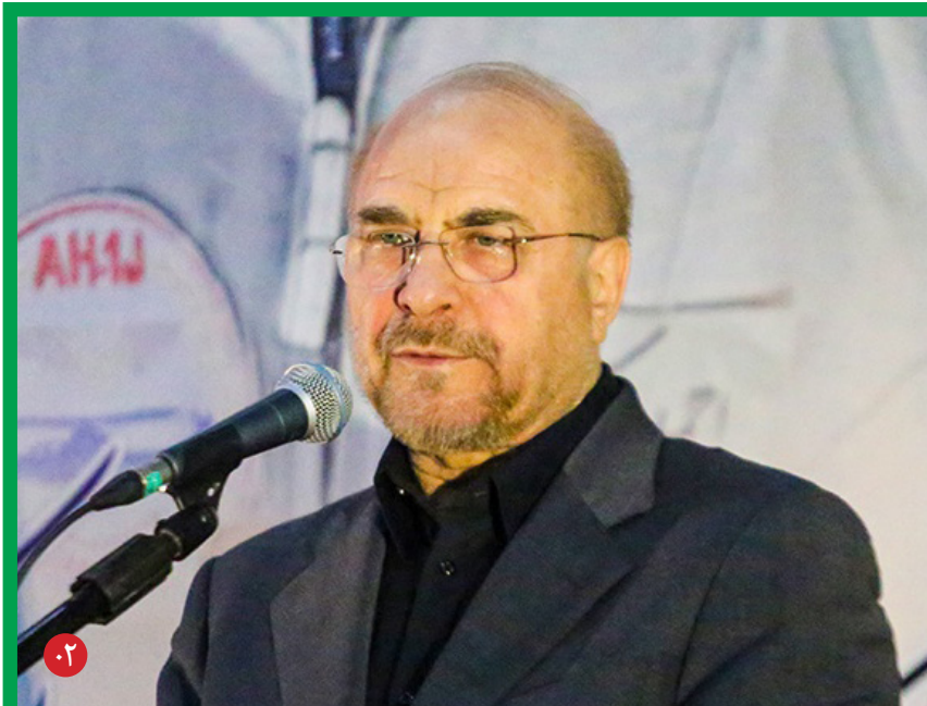
رئیس مجلس شورای اسلامی در مراسم سالگرد شهادت سیمیرغ آسمان ایران «سردار شهید احمد کشوری» و یادواره شهدای شهرستان سیمیرغ:

برای گره‌گشایی از مشکلات مازندران تلاش خواهیم کرد