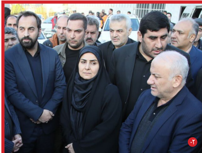
وزیر راه و شهرسازی در بازدید از پروژه‌های عمرانی و با اشاره به کمبود زمین در استان: