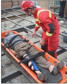
یک نفر از پرسنل اورژانس در حال انتقال یک مصدوم با استفاده از یک تخت مخصوص به بیمارستان است.