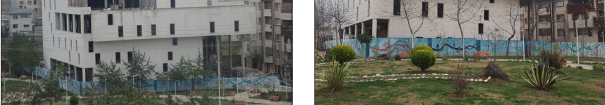
کتابخانه مرکزی ساری در حال ساخت است.

کتابخانه در دست ساخت مرکزی ساری بخش‌های مختلفی از جمله بخش امانت، پیشخوان، سرسرای مطالعه عمومی و vip، بخش بزرگ کودک با کارکرد فرهنگی مختلف برای خردسالان و کودکان، بخش اتاق علم، ویژه نوجوانان که محلی برای برگزاری کلاس‌های آموزشی، عمومی و خصوصی است. این کتابخانه همچنین دارای قسمت‌هایی مانند