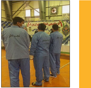
موزه صنایع دستی تهران