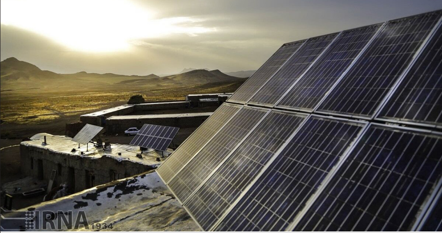
نمای نزدیک از یک نیروگاه خورشیدی کوچک مقیاس در استان گلستان

نیروگاه‌های خورشیدی کوچک مقیاس کردند که دستگاه‌هایی مانند دادگستری گلستان در ۶ شهر، شهرک‌های صنعتی گنبدکاوس، مینودشت، حیدرآباد و آق‌قلا و همچنین شرکت شهرک‌های صنعتی در گرگان، آب و فاضلاب گلستان، شرکت گاز و کمیته امداد گلستان پیشگام هستند. نظری: براساس سیاست‌های ابلاغی رهبر معظم انقلاب در سال «جهش تولید با مشارکت با مردم» و همچنین در راستای سیاست دولت مبنی بر حمایت از دهک‌های پایین درآمدی جامعه و حمایت از مددجویان زیر پوشش برای ایجاد نیروگاه‌های خورشیدی کوچک