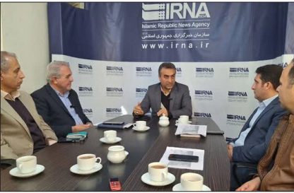
امین‌دوادم‌با کمیته امداد برای تولید برق خورشیدی

نظری: در وهله اول، متقاضیان باید در پشت بام خانه خود فضای برای برپایی پنل خورشیدی داشته باشند، همچنین امتیاز برق باید به نام متقاضی و ملک موردنظر متعلق به صاحب انشعاب برق باشد. متقاضیانی که از کمیته امداد برای ایجاد نیروگاه‌های خورشیدی کوچک مقیاس کمک می‌گیرند باید زیرپوشش این نهاد و جزو دهک در آمدی یک تا پنج باشند و علاوه بر آن، دریافت‌کننده مستمری و بیمه