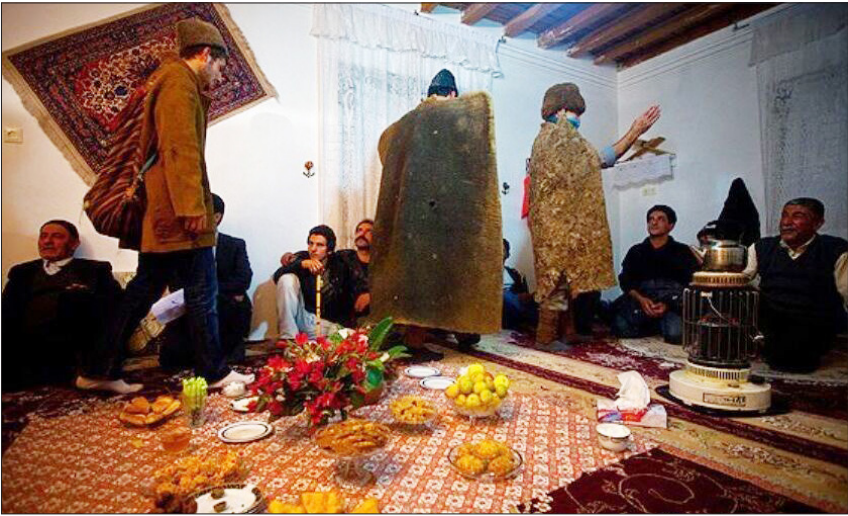
مراسم تیرماسیزه‌شو در خانه‌های مازندرانی‌ها در شب ۱۳ آبان

فرماندار بابل گفت: همزمان با روز مازندران شهروندان علاقه‌مند، به صورت رایگان در قالب تور بابل گردی از بناهای تاریخی این شهر بازدید می‌کنند. علی پیرفلک در نشست خبری در بابل اظهار کرد: بازدید از بناها و خانه‌های تاریخی شهر بابل یکی از چند برنامه مهم این شهرستان برای روز مازندران است. وی گفت: تور بابل گردی که در سال گذشته برگزار شد مورد استقبال شهروندان قرار گرفت و در سال جاری هم شهروندان به صورت رایگان از مکان‌های دیدنی شهر بابل بازدید می‌کنند. فرماندار بابل با اشاره به این مطلب که ۱۵ آبان با تصویب شورای فرهنگ عمومی شهرستان به نام روز بابل نام‌گذاری شد، اظهار کرد: همه این شرایط سبب شد که برنامه‌های هفته مازندران متفاوت‌تر از سالهای گذشته در این شهرستان برگزار شود. پیرفلک افزود: فرهنگ غنی مازندران ریشه در ارزش‌های دینی دارد و در طول تاریخ سینه به سینه این پیشینه ارزشمند برای ما زنده ماند. این مقام مسوول تصریح کرد: در سال جاری تلاش شد تا برنامه‌های هفته مازندران در همه بخش‌های شهرستان به صورت ویژه برگزار شود.