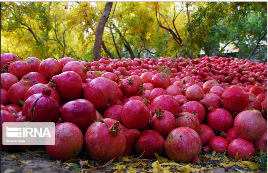
پاقوت چینی در گلستان

از اواخر زمستان سال قبل با بهره‌گیری از تجربه کارشناسان اقدام به استفاده از سم قارچ روی درختان کردم و در اردیبهشت و خرداد هم این کار را ادامه دادم. وی ادامه داد: آبیاری منظم و بدون تاخیر درختان انار دیگر راهکاری بوده که آن را سرموعد مقرر انجام و درختان را نشنه نگذاشتم. این باغدار، جمع آوری علف‌های هرز از پای درختان، هرس درختان انار از وجود شاخه‌های زائد و مقاوم کردن آن‌ها در برابر وزش باد شدید و جمع کردن خاک در پای تنه درخت و پیشگیری از یوسیدگی درختان را دیگر اقدام برای ایجاد انارستان برشمرد. وی با تاکید بر استفاده از کود فسفات برای رشد بهتر درختان انار، گفت: برای این باغ یک فسفاتی و ۷۰۰ درخت انار به دست‌کم چهار کیسه کود فسفات نیاز دارم که استفاده از آن موجب تامین مواد غذایی مورد نیاز رشد درخت از جمله آهن، روی، منگنز، فسفر شده و از سفیدی دانه‌های انار پیشگیری می‌شود. وی خاطر‌نشان کرد: اگر پرچم‌های داخل گلوی انار را خالی نمی‌کردم، آفت و بیماری کرم ساقه خوار گلوگاه، باغ انار را فرامی‌گرفت و محصولی با این کیفیت به دست نمی‌آمد.