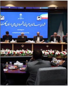
عضو هیات علمی موسسه تحقیقات پنبه با بیان اینکه قیمت پنبه عادلانه نیست، گفت: در سال های گذشته