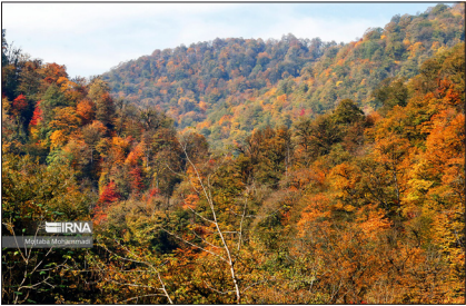
جنگل‌های هیرکانی در استان مازندران.

کارشناس محیط زیست نقش جنگلهای انبوه گلیران بابل را در تولید و تنظیم آب برای روستاها و شالیزارهای پایین دست بسیار مهم می‌دانند و هر