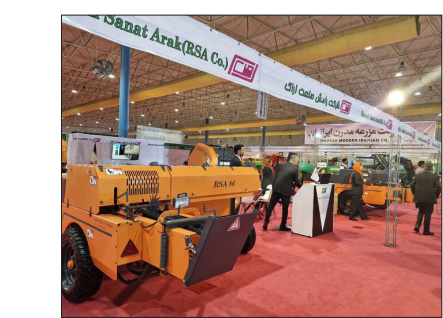
نمایشگاه تخصصی ماشین‌های کشاورزی در گرگان

سال قبل این نمایشگاه تخصصی کشاورزی در گرگان با حضور ۷۰ تولید کننده و صنعتگر برتر استان کشور دستاوردهای خود را بیشتر در فضای سرپوشیده به نمایش گذاشته بودند. استان گلستان با بیش از ۲۰ هزار کیلومتر مربع وسعت، طبق سرشماری نفوس و مسکن سال ۱۳۹۵، یک میلیون و ۸۶۹ هزارنفر جمعیت دارد و اقتصاد اصلی آن بر پایه کشاورزی استوار است. سالانه ۶۶۷ هزار هکتار از زمین‌های گلستان به زیر کشت محصولات کشاورزی به ویژه غلات همچون گندم و دانه‌های روغنی می‌رود که حاصل آن کسب ۱۵ رتبه برتر کشوری در تولید اقلام مختلف است.