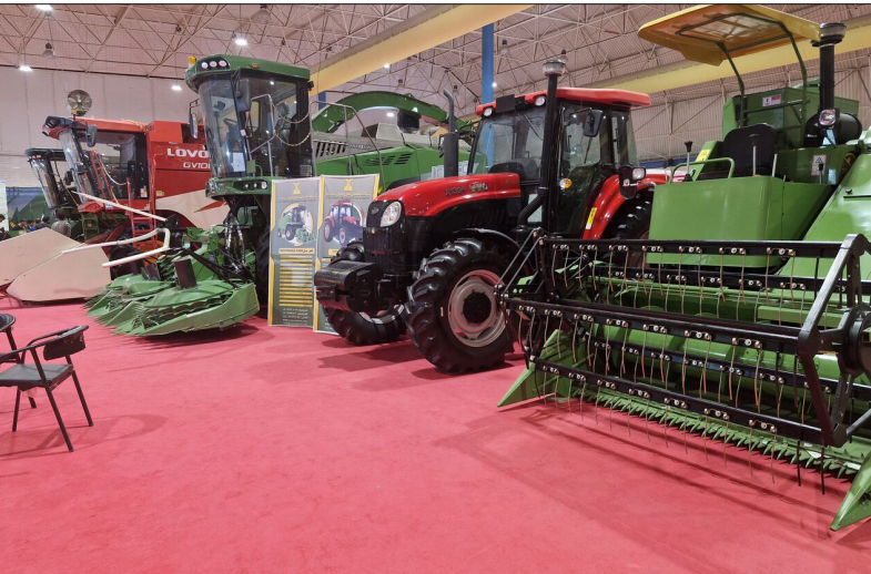
نمایشگاه تخصصی ماشین‌های کشاورزی در گرگان