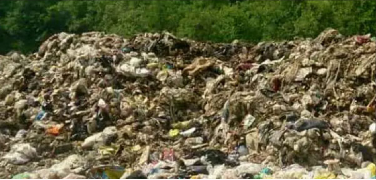
پسماندهای مازندران در حاشیه جنگل آمل

پای زباله مازندران بعد از استان سمنان، به گلستان نیز باز شده و این روزها صدای مردم و مسوولان و فعالان محیط زیستی گلستان را درآورده تا جایی که مردادماه امسال برای آن کارزار نیز به راه افتاده است. معاون عمرانی استاندار گلستان نیز با توجه به اهمیت ماجرا طی روزهای گذشته در سخنانی با اشاره به اینکه