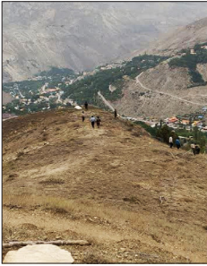
قلع و قمع بنای غیرمجاز و آزادسازی ۳ هکتار از اراضی ملی در آمل

«خبرشمال» با توجه به سرایتِ زباله‌های مازندران به همسایه شرقی گزارش می‌دهد؛