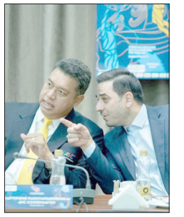
میلاد به آسیا رسید