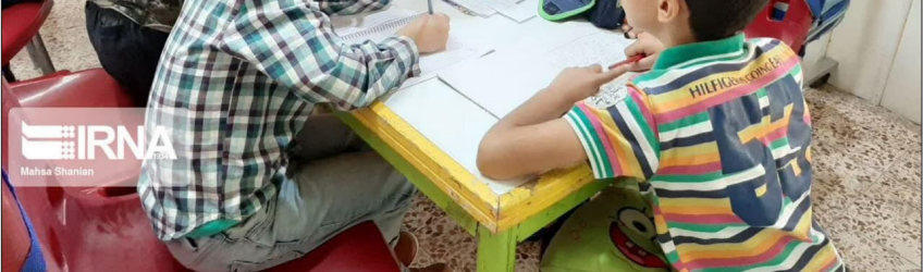
گروهی از دانش‌آموزان در حال شرکت در کارگاه آموزشی مهارت‌آموزی در یکی از مراکز آموزشی شهرستان گیلان.

زمینه به خبرگزاری دولت گفت: تاکنون ۴۲ هزار نفر از دانش‌آموزان استان برای شرکت در کلاس‌های طرح اوقات فراغت نام‌نویسی کردند که بیشترین آن مربوط به گنبدکاووس، آق قلا، کردکوی و گرگان هستند. موسی