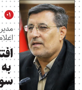
مدیرعامل شرکت گاز مازندران اعلام کرد:

محکومیت قاچاقچیان قارچ ترافل جنگلی در کلاله