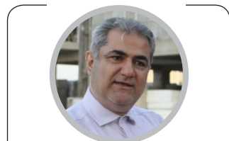
معاون وزیر راه و شهرسازی در گیلان:

«تحکیم بستر» چالش اصلی مسکن‌سازی در شمال کشور است