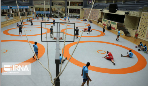
بازیکنان تیم ملی کشتی آزاد جوانان ایران در حین تمرین