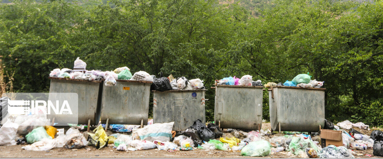
مدیرکل حفاظت محیط زیست گیلان در جریان بازدید از مراکز تولید کود آلی در شهرستان رشت.

از دوربین‌های هوشمند میزان آتش سوزی در اراضی تالابی ۸۰ درصد کاهش داشته است و یک پایگاه اطفاء حریق نیز با اعتبار ۲۰ میلیارد ریال در منطقه «قلم گوده» انزلی به بهره برداری رسید. وی تصریح کرد: یکی دیگر از مواردی که برای نخستین بار در دولت سیزدهم در حوزه محیط زیست اتفاق افتاد پرداخت خسارت به دامداران آسیب دیده از حیات وحش است. وی با بیان اینکه ۷۷ پرونده خسارت در این خصوص برای استان تشکیل شده بود، افزود: در این راستا بیش از ۱۰ میلیارد ریال خسارت پرداخت شد و گیلان در این حوزه جزوه سه استان برتر کشور شناخته شد.