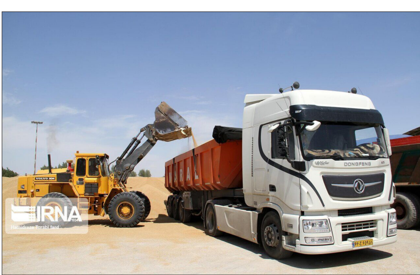
افزایش هدر رفت گندم در مسیر مزرعه تا انبار؛ راهکار چیست؟