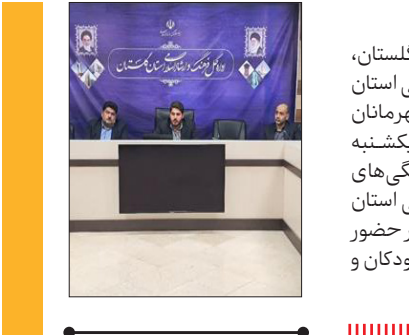
مراسم افتتاحیه جشنواره صنایع دستی گلستان.