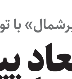
خرید - فروش - رهن - اجاره