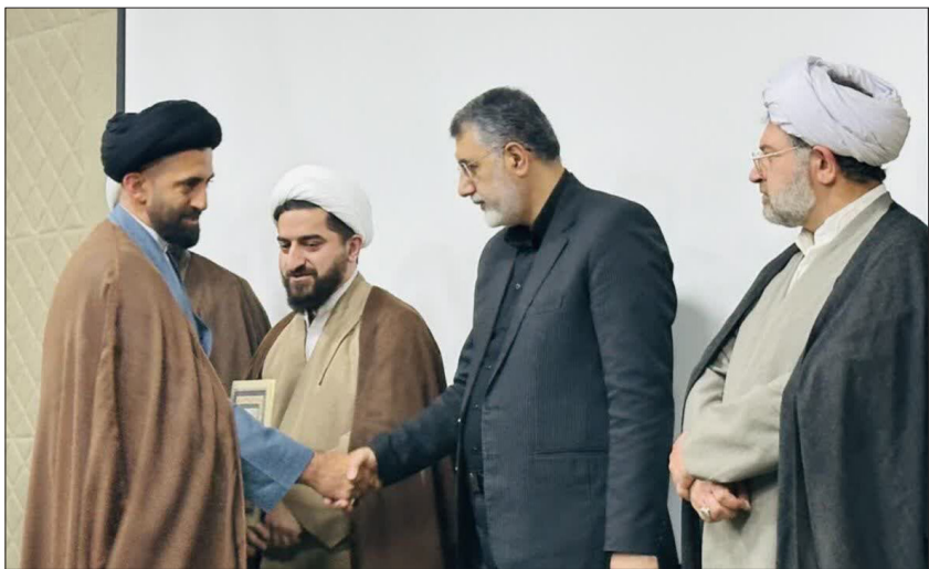
خارجی، مدرک گرایبی، نبود تحلیل در پژوهش و مازندران با بیان این که پژوهش ها باید خروجی داشته

معاون سیاسی، امنیتی و اجتماعی استاندار مازندران: