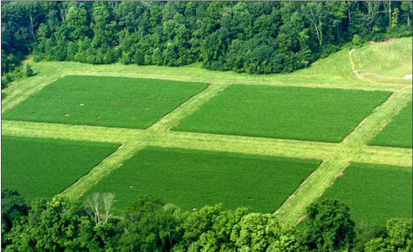
مازندران با اشاره به اینکه منظور اصلی سیستم‌های تولید فرآورده‌های ارگانیک پهنه سازی تولید، افزایش کیفیت محیط زیست و رفاه مصرف کنندگان است، خاطر نشان کرد: کشاورزی ارگانیک سازوکاری است که با تکیه بر منابع بومی و داخلی به حفظ و حمایت از تعادل بوم‌شناختی توجه داشته و یک سیستم ترکیبی کشاورزی بر اساس اصول بوم‌شناسی است.