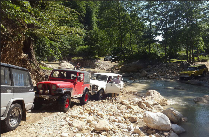
آفرود سواری در استان مازندران

سازمان است، گفت: سازمان جنگل‌ها بی‌ظمی در جنگل را نمی‌پذیرد و با آفرود سواری در جنگل برخورد قضایی می‌کند. عباسعلی نوبخت در این‌باره اظهار داشت: اکنون در شرایط توقف بهره‌برداری از جنگل‌های شمال قرار داریم و از پایان سال ۹۶ بهره‌برداری از جنگل به طور کلی متوقف شده است و جنگل با زاداوری و رویش و زایش گونه‌های گیاهی مواجه شده است و برای اینکه این تجدید حیات آسیب نبیند اجاره ورود خودرو به جنگل را نمی‌دهیم. وی ادامه داد: مدیران مناطق چهارگانه شمال در خصوص آفرود سواری در جنگل به دلیل آسیب‌های وارده به جنگل حساسیت ویژه‌ای دارند و هر کانون و سازمانی بخواهد اتومبیل‌رانی در جنگل راه‌اندازی کند متخلف شناخته شده و برایش پرونده تخلف صادر می‌شود. نوبخت ادامه داد: ما باید به استاندارهای لازم جهانی در جنگل‌های هیرکانی دسترسی پیدا کنیم و اگر نتوانیم به هر دلیلی به استانداردهای لازم و مد نظر یونسکو نزدیک شویم قطعاً این فرصت و امتیاز از جنگل‌های هیرکانی سلب خواهد شد.