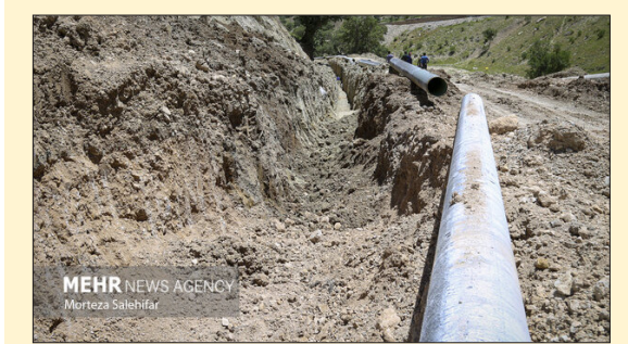
مدیرعامل شرکت مدیریت تولیدبرق نکا از پایان تعمیرات نیمه اساسی و راه‌اندازی مجدد واحد یک بخار نیروگاه شهیدسلیمی نکا خبر داد.