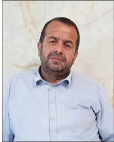
علی محمد زنگانه استاندار گلستان در آیین نکوداشت