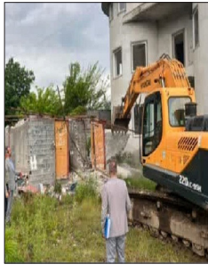
تخریب ۹ ویلای در حال ساخت