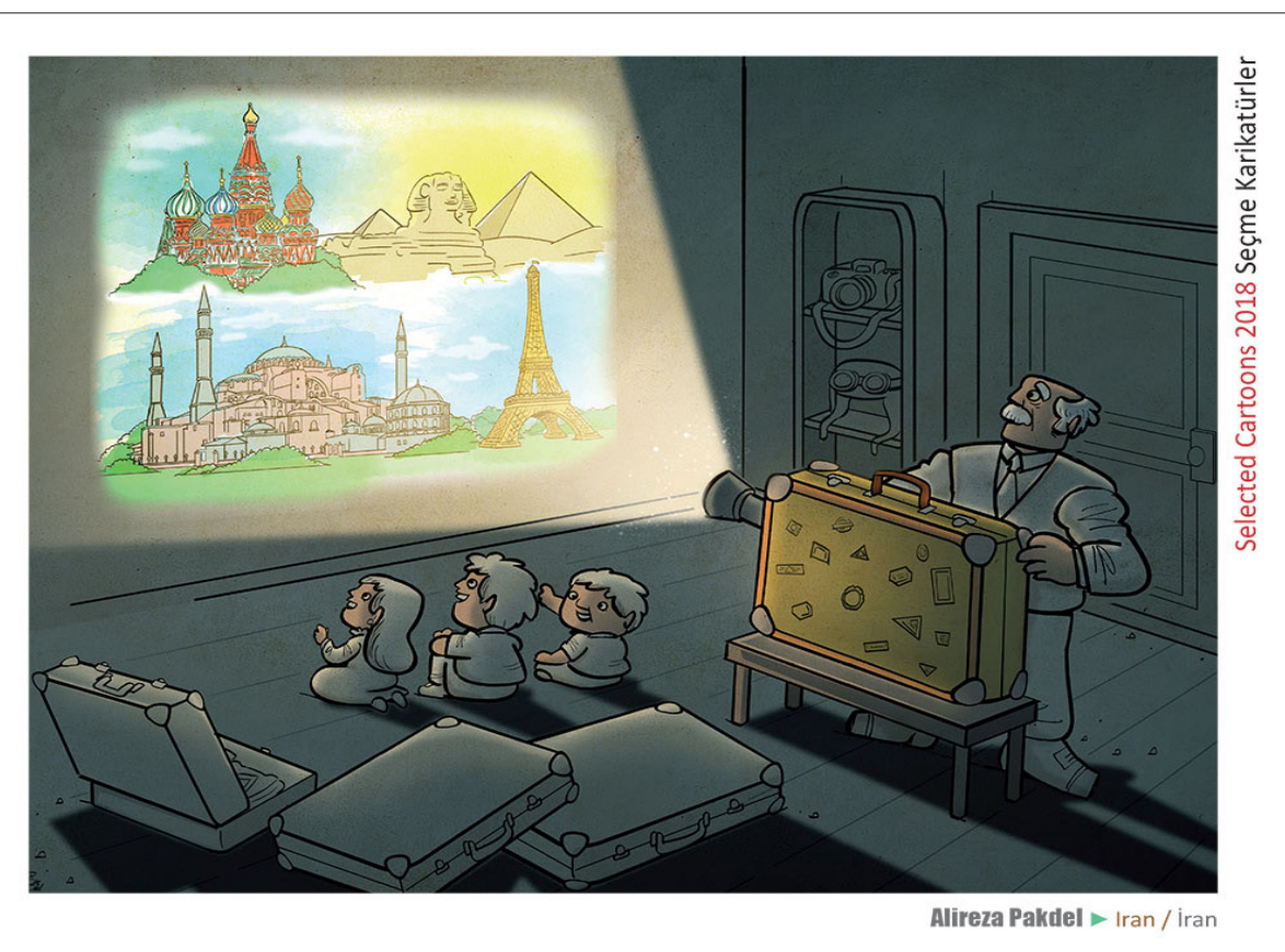
Alireza Pakdel | Iran / Iran