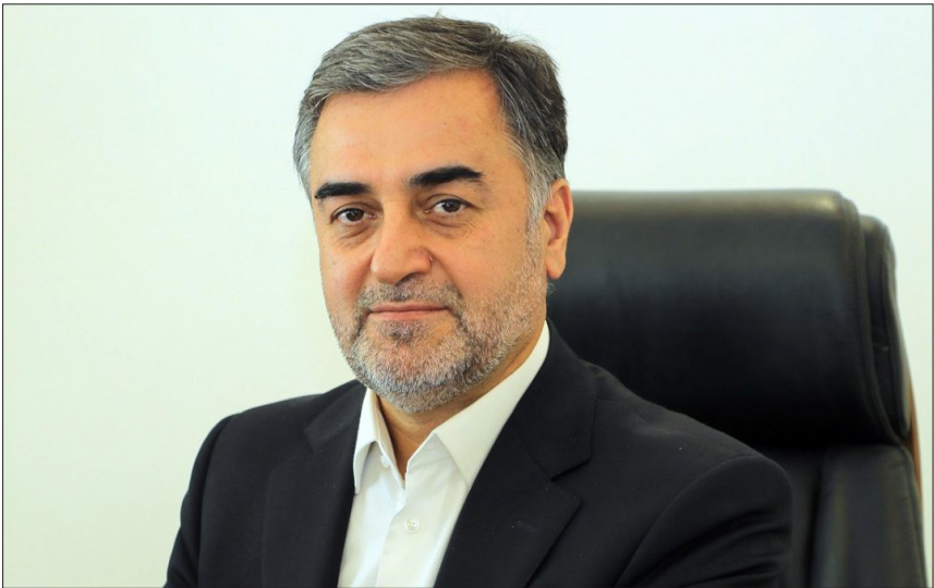
سید محمود حسینی‌پور، استاندار مازندران