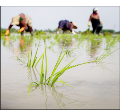
رئیس سازمان جهاد کشاورزی گیلان

بر اساس اعلام جهاد کشاورزی گیلان از ۲۳۸ هزار هکتار اراضی شالیبازی استان پیش بینی می‌شود که افزون بر ۱۳۵ هزار هکتار زیر کشت دوم انواع محصولات کشاورزی برود که راتون یکی از این محصولات در کشت دوم است. شالیکاران جامانده استان گیلان برای دریافت حواله کود اقدام کنند. با توجه به نزدیک شدن به روزهای آغاز کشت برنج ضروریست تا شالیکاران نسبت به لایروبی آنهاورودی به شالیزارها و حذف علف‌های هرز در مزارع، مرزاها و مسیر کانال‌های آب اقدام کنند.استاندار گیلان چندی پیش در جلسه کارگروه تنظیم بازار در استانداری گیلان با بیان اینکه هزینه تولید برنج بالا است، گفته بود: قیمت کنونی این محصول در بازار گیلان با توجه به هزینه تولید در مزارع واقعی نیست و جهاد کشاورزی استان موظف است هزینه تمام شده محصول را مشخص و اعلام کند.