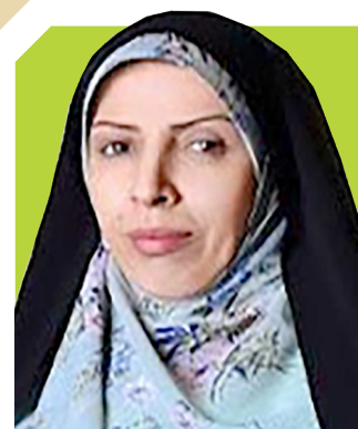
● عالییه زمانی ساری و میانرود