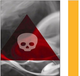
فوٲ ۴ عضو یک خانواده در علی