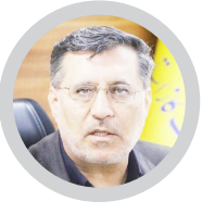
مدیرعامل شرکت گاز مازندران خبر داد؛