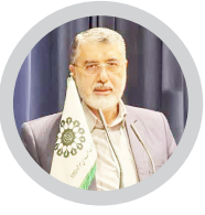
با حکم استاندار صورت پذیرفت؛