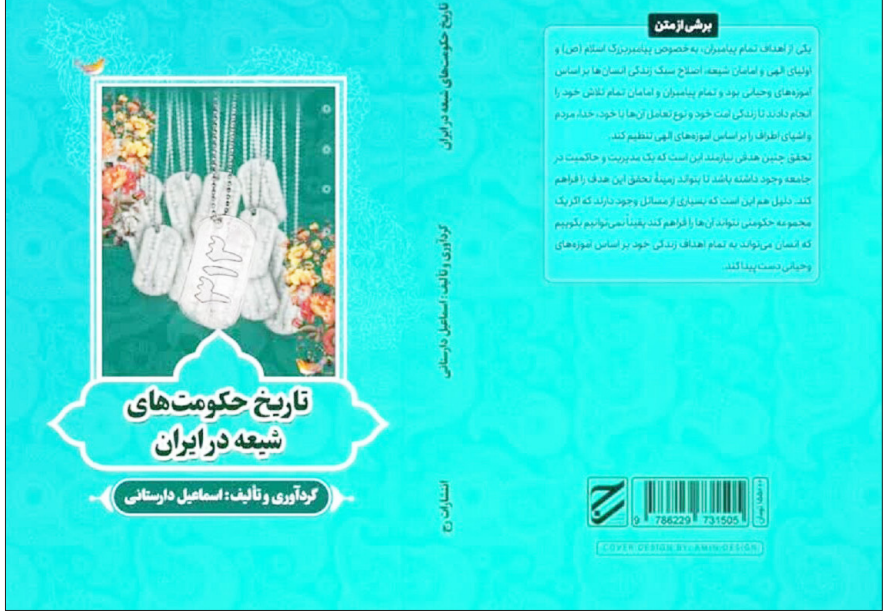
تاریخ حکومت‌های شیعه در ایران