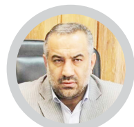
رییس کل دادگستری گلستان:

دانش آموزان بازمانده از تحصیل شناسایی و تحت آموزش قرار گیرند