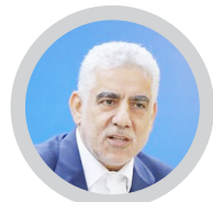
استاد ارشد گیلان:

دانش آموزان بازمانده از تحصیل شناسایی و تحت آموزش قرار گیرند