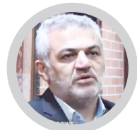
مدیرکل راه و شهرسازی

حمایت از سرمایه‌گذاران اولویت همیشگی دستگاه قضایی است