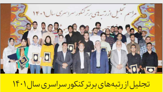
تجلیل از رتبه‌های برتر کنکور سراسری سال ۱۴۰۱