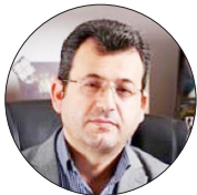
مدیرکل کمیته امداد استان اعلام کرد:

سامانه‌های شدن خدمات روستایی در استان در دستور کار است