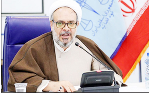
رئیس کل دادگستری استان گیلان: مجازات‌های جایگزین حبس، راهکاری برای کاهش ورودی زندانیان است