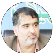
سرپرست سازمان جهاد کشاورزی مازندران:

گلستان یکی از ۳ استان برتر کشور در جمع آوری زکات