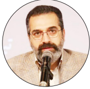
سرپرست معاونت هماهنگی امور عمرانی استانداری مازندران:

سامانه‌های شدن خدمات روستایی در استان در دستور کار است