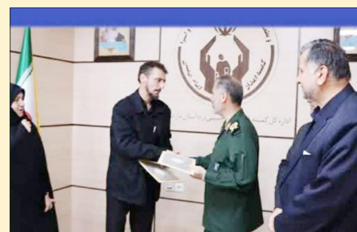
مدیرکل کمیته امداد مازندران گفت: تا پایان امسال هزار و ۵۳۷ مسکن احداث و تحویل مددجویان کمیته امداد می شود.

مدیرکل کمیته امداد مازندران با اشاره به اینکه در استان، ۱۱ هزار و ۶۰۰ مددجوی فاقد مسکن، که ۸ هزار نفر فاقد زمین هستند داریم، گفت: امروز تفاهم نامه برای ساخت هزار و ۵۳۷ مسکن امضا شد که براساس آن تا پایان سال این واحدها تحویل مددجویان می شود و همچنین ارتباطات و تعاملات کمیته امداد امام خمینی و بهزیستی در پنج شنبه های جهادی که در روستاهای دور دست برگزار می شود امضا خواهد شد.