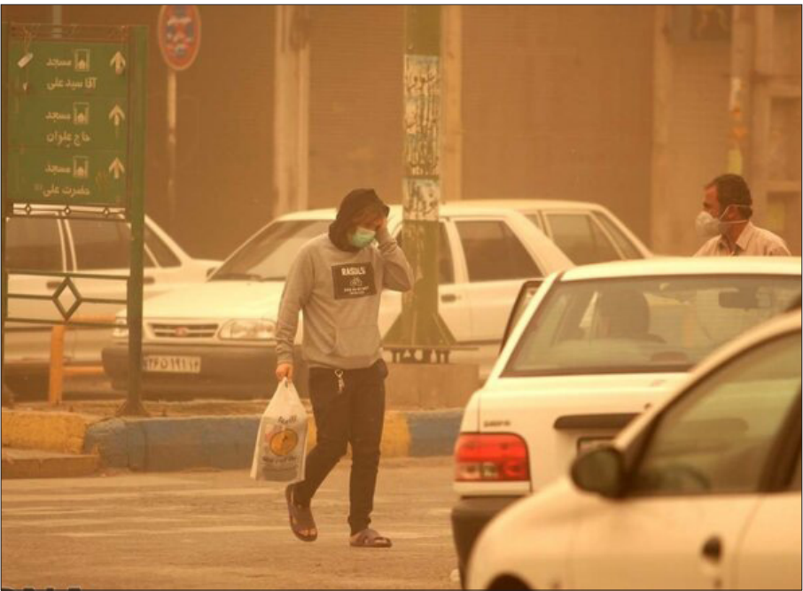
یک نفر در حال فرار از گرد و غبار در یک خیابان در مشهد، ۲۰۰۷

● کاهش قدرت دید یکی از ویژگی‌های اصلی پدیده گرد و غبار است. علاوه بر آثار ناخوشایند بهداشتی مانند مشکلات تنفسی و ریوی برای انسان و آلوده کردن