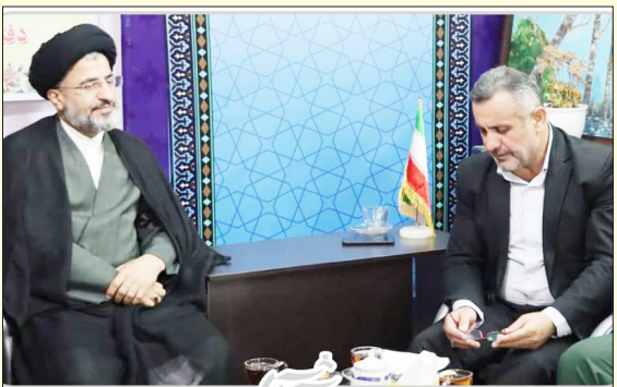
دیدار با امام جمعه شهرستان محمودآباد به مناسبت گرامیداشت هفته دولت