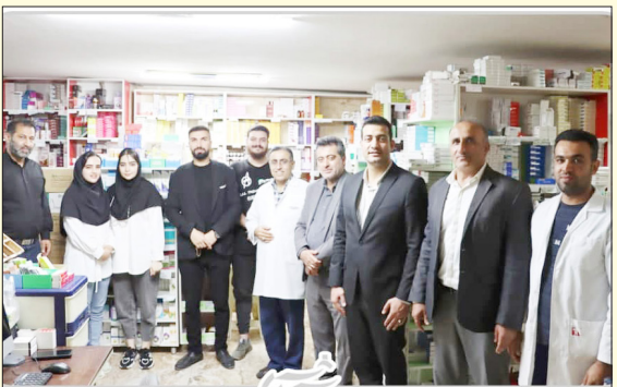
دیدار با پزشکان به مناسبت روز پزشک