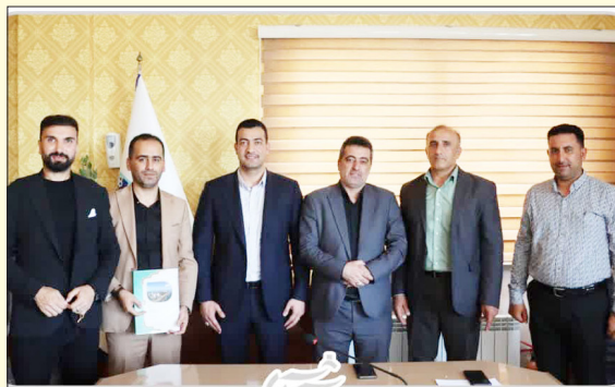
آیین تجلیل از خبرنگاران و اصحاب رسانه