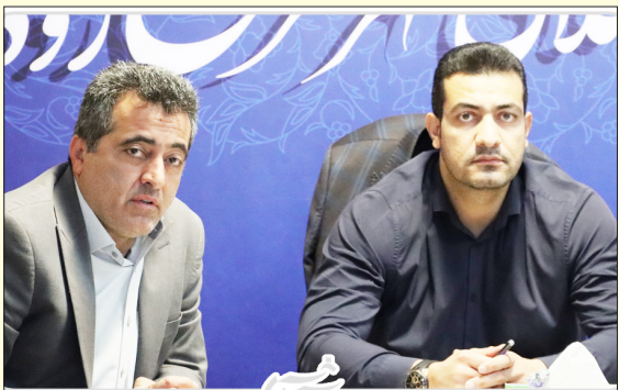
جلسه شهردار و اعضای شورا شهر