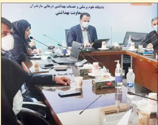
دانشگاه علوم پزشکی و خدمات بهداشتی درمانی مازندران معاونت بهداشتی