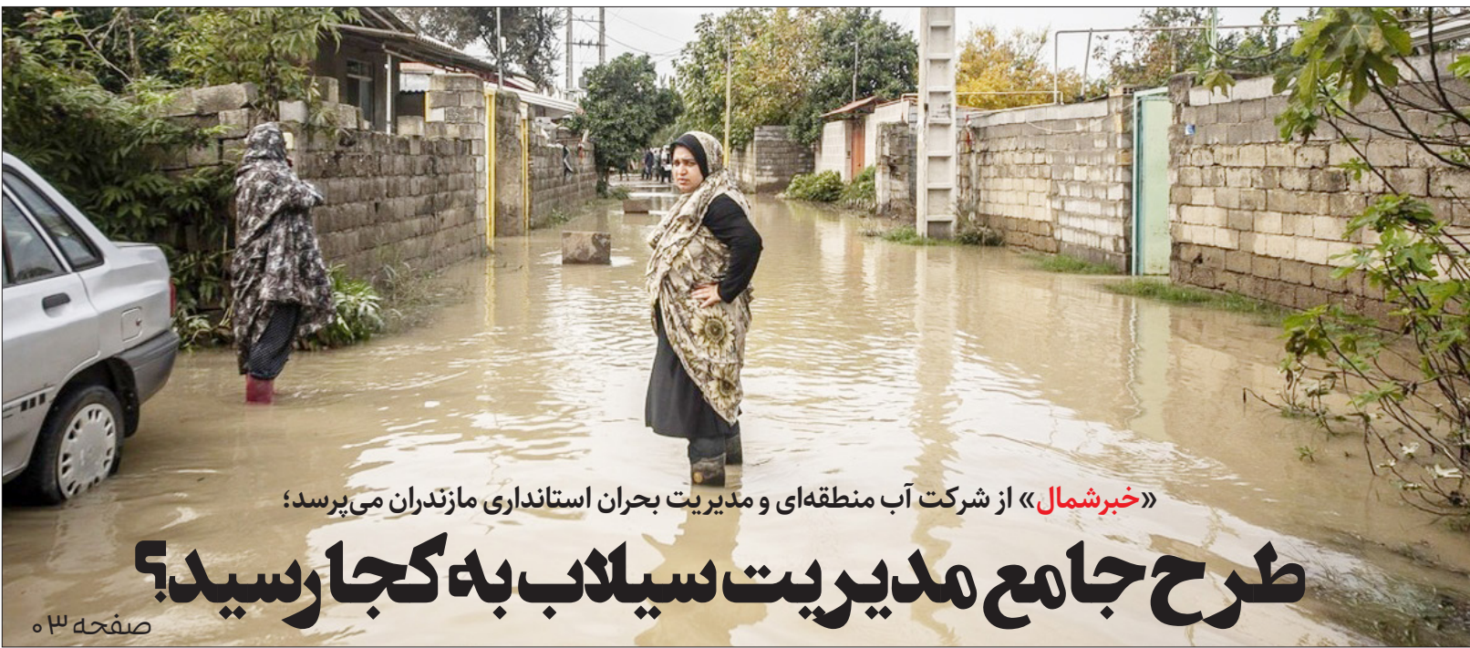
«خبرشمال» از شرکت آب منطقه‌ای و مدیریت بحران استانداری مازندران می‌پرسد: