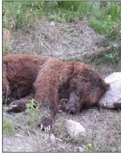
خرس قهوه‌ای در جنگل سوادکوه