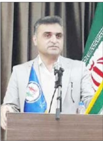
Portrait of the Director General of Fisheries of Mazandaran.

مازندران را زیر پوشش قرار می‌دهند. وی در همین زمینه افزود: در شهرهای زیر ۵۰ هزار نفر جمعیت هر پزشک خانواده به دوهزار و ۵۰۰ نفر خدمات درمانی ارائه می‌کند و تمامی کنترل‌های لازم درمانی افراد از طریق این پزشکان برای افراد انجام می‌شود و در صورت نیاز به دریافت سطوح بالاتر دریافت خدمات اقدام لازم برای ارجاع به پزشک متخصص در این طرح قرار دارند انجام می‌شود. گفتنی است ۲۶ بیمارستان دولتی، ۱۴ بیمارستان خصوصی به تعداد حدود پنج هزار تخت بیمارستانی، بیش از یک هزار و ۱۰۰ خانه بهداشت و ۴۵۰ مرکز جامع شهری و روستایی بخشی از امکانات موجود این دانشگاه به شمار می‌رود.