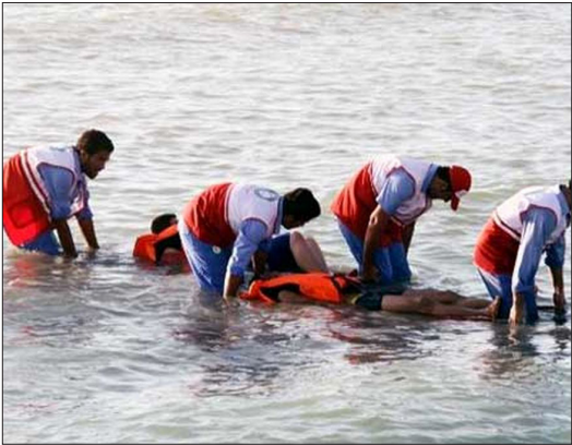
نجاتی‌یافتگان غرق‌شدگان در دریای خزر