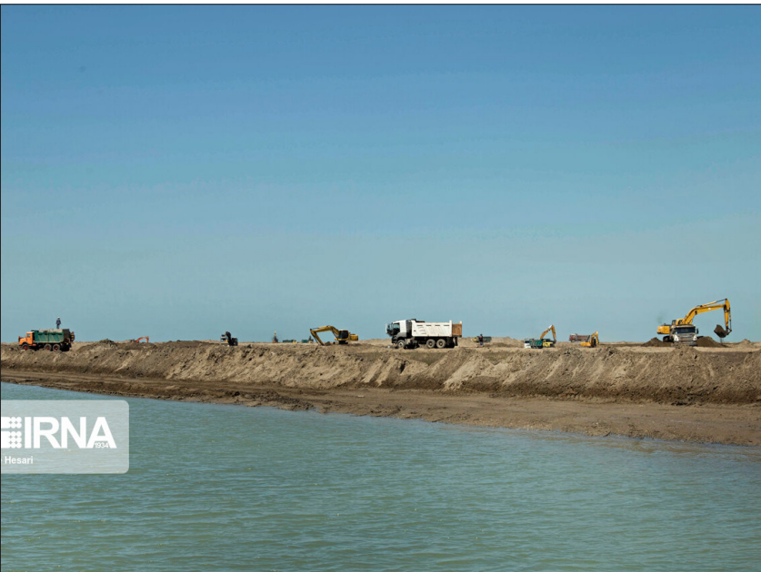
لایروبی کانال اصلی آبرسان خلیج گرگان

بسیاری از جانداران در بزرگ‌ترین دریاچه زمین به اتصال آن با دریا وابسته است.