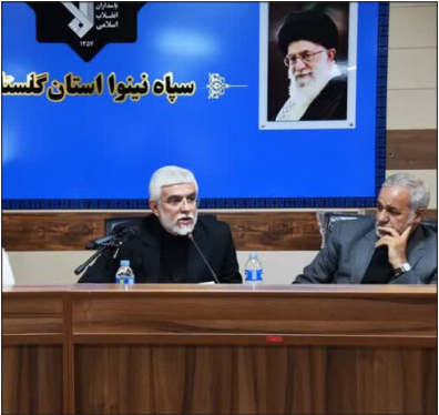
استاندار گلستان در دیدار با فرمانده فرارگاه خاتم الانبیا

پس از حضور آیت‌الله سیدابراهیم ریسی در خلیج گرگان در ۱۲ اسفند ماه سال ۱۴۰۰، وی دستور فوری آغاز لایروبی و رسوب‌برداری از کانال‌های سه‌گانه منطقه را صادر کرد و پس