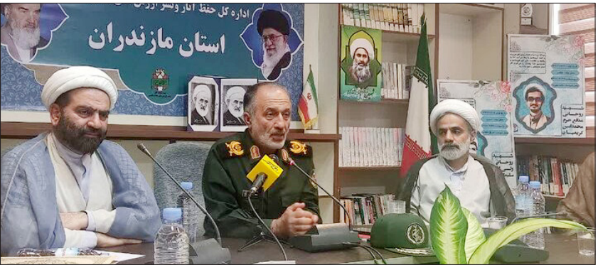
اداره کل حفظ آثار و نشر اثار

مدیرکل حفظ آثار و نشر ارزش‌های دفاع مقدس مازندران با اشاره به نقش آفرینی روحانیت پرچمدار انقلاب اسلامی و سنگربان به شمار می‌روند.