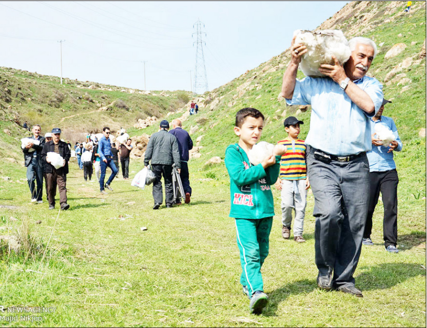
ورف چال ویژه مازندران، و به معنای چاهی است که اهالی روستای اسک هر ساله در یکی از روزهای ماه اردیبهشت حفر کرده و داخل آن را پر از برف می‌کنند. قول و قرار مردم بخش لاریجان و شهرستان آمل روزهای آخر اردیبهشت، بای دماوند، منطقه اسک وش است. براساس رسم به جای مانده ازاین آئین کهن، در این روز هیچ زنی حق ورود به محل برگزاری مراسم را ندارد و در مقابل نیز هیچ مردمی حق ورود به روستای اسک را نخواهد داشت.