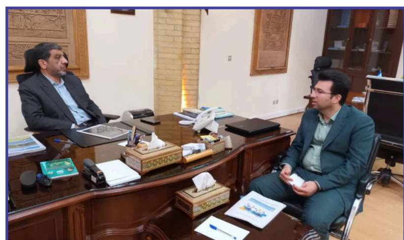
لازم جهت رفع آن برنامه ریزی می گردد.

در دیدار مدیر کل میراث مازندران با وزیر گردشگری مورد بحث قرار گرفت؛