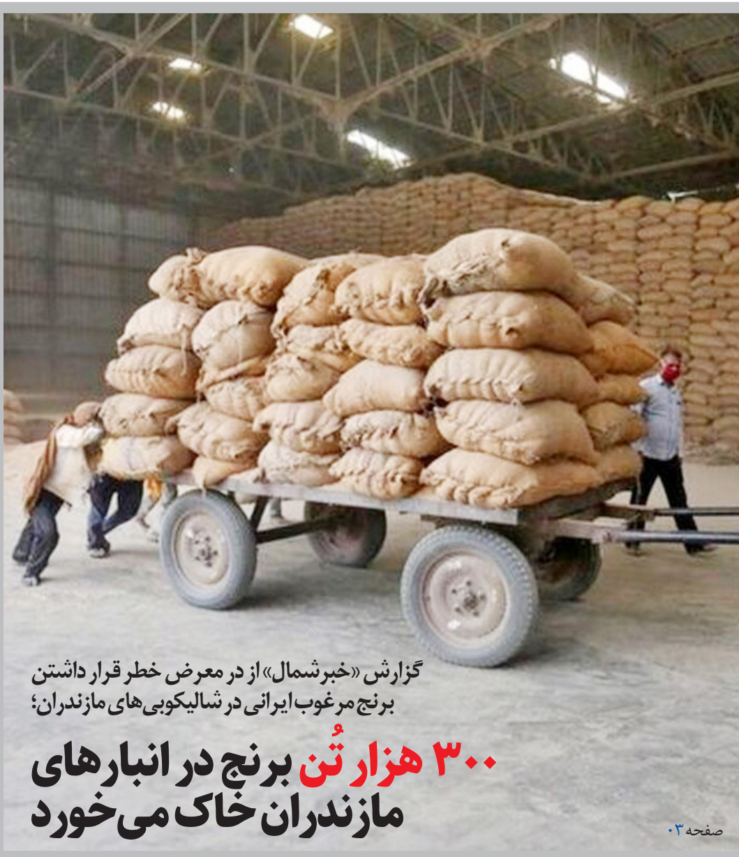
گزارش «خبرشمال» از در معرض خطر قرار داشتن برنج مرغوب ایرانی در شالیکوبی‌های مازندران؛

۳۰۰ هزار تن برنج در انبارهای مازندران خاک می‌خورد