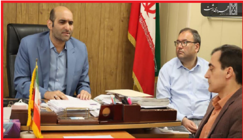
کار به شکل گزارش‌های روزانه به اطلاع روابط عمومی شهرداریهای مناطق برسد.

تاج شهرستانی در جلسه توصیه کرد: لازم است معابر مناطق کوچک به کوچمه مورد رصد قرار گیرد و ضمن شناسایی معابر فاقد نام یا مخدوش شده، نتیجه