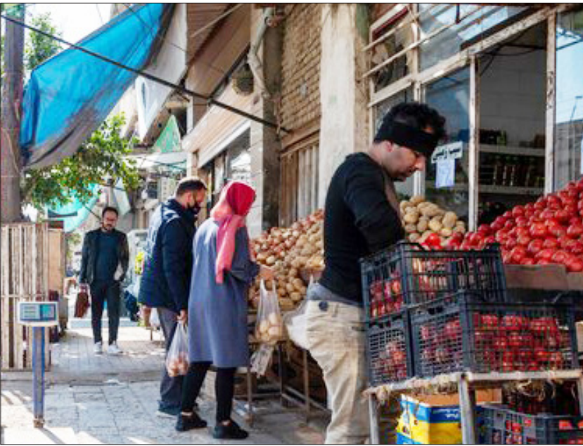
بازار محلی در گرگان

یکی از کسبه خیابان امام خمینی (ره) گرگان: با توجه به اینکه هیچ کسبه‌ای علاقه ندارد جلوی مغازه اش توسط دستفروشان اشغال شود اما گاهی مواقع مشاهده می‌شود که برخی از مغازه دارها حتی شب‌ها وسایل دست فروش را درون مغازه خود نگهداری می‌کنند. اگر عده معدودی که از سر خیرخواهی این کار را انجام می‌دهند، کنار بگذاریم پرواضح است که اجاره جلوی مغازه آسری غیرقابل اجتناب است اما مدرکی برای اثبات آن وجود ندارد