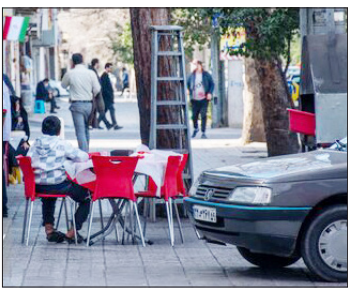
مغازه‌های اطراف خیابان امام خمینی در گرگان

یکی از کسبه خیابان امام خمینی (ره) گرگان: با توجه به اینکه هیچ کسبه‌ای علاقه ندارد جلوی مغازه اش توسط دستفروشان اشغال شود اما گاهی مواقع مشاهده می‌شود که برخی از مغازه دارها حتی شب‌ها وسایل دست فروش را درون مغازه خود نگهداری می‌کنند. اگر عده معدودی که از سر خیرخواهی این کار را انجام می‌دهند، کنار بگذاریم پرواضح است که اجاره جلوی مغازه آسری غیرقابل اجتناب است اما مدرکی برای اثبات آن وجود ندارد